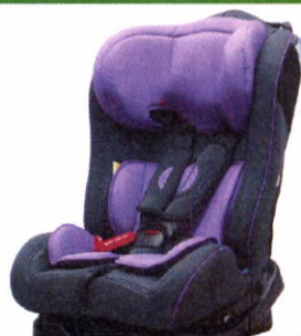
Автокресло группы II для детей массой 15-25 кг