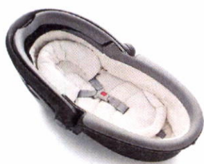
Автокресло «люлька» группы 0 для детей массой менее 10 кг

Детские удерживающие устройства подразделяют на 5 весовых групп: