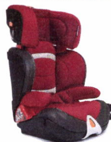
Автокресло группы III для детей массой 22-36 кг (возможно использование бустера)